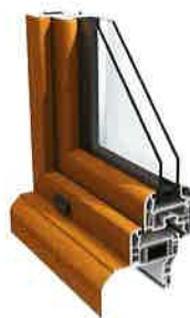
Swingline 70 mm

Traditionnel, courant ou contemporain, les 3 designs PVC LEUL s'accordent à votre intérieur pour un tarif unique.