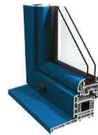
Kietisline contemporaine 78