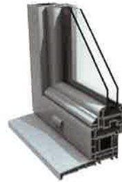
Swingline 70 mm traditionnelle